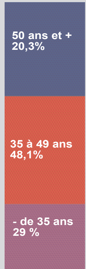
ÂGE DES INTERNAUTES