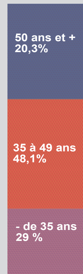
ÂGE DES INTERNAUTES